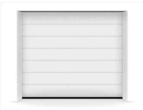
(Beispielfotos zu Vereinfachung der Motivauswahl, Sektionaltor mit der M-Sicke in Farbe RAL9016 Verkehrsweiß)