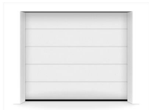
(Beispielfotos zu Vereinfachung der Motivauswahl, Sektionaltor mit der L-Sicke in CH9016 Verkehrsweiß Matt Deluxe)

Hinweis: Sofern Sie Hilfe bei der Auswahl der Sicke und der Farbe benötigen, besuchen Sie die Seite https://www.hoermann.de/konfigurator